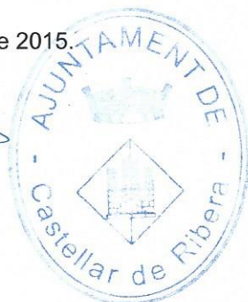
Sílvia Vilaseca Casafont Secretària

Castellà de la Ribera, 03 de setembre de 2015.